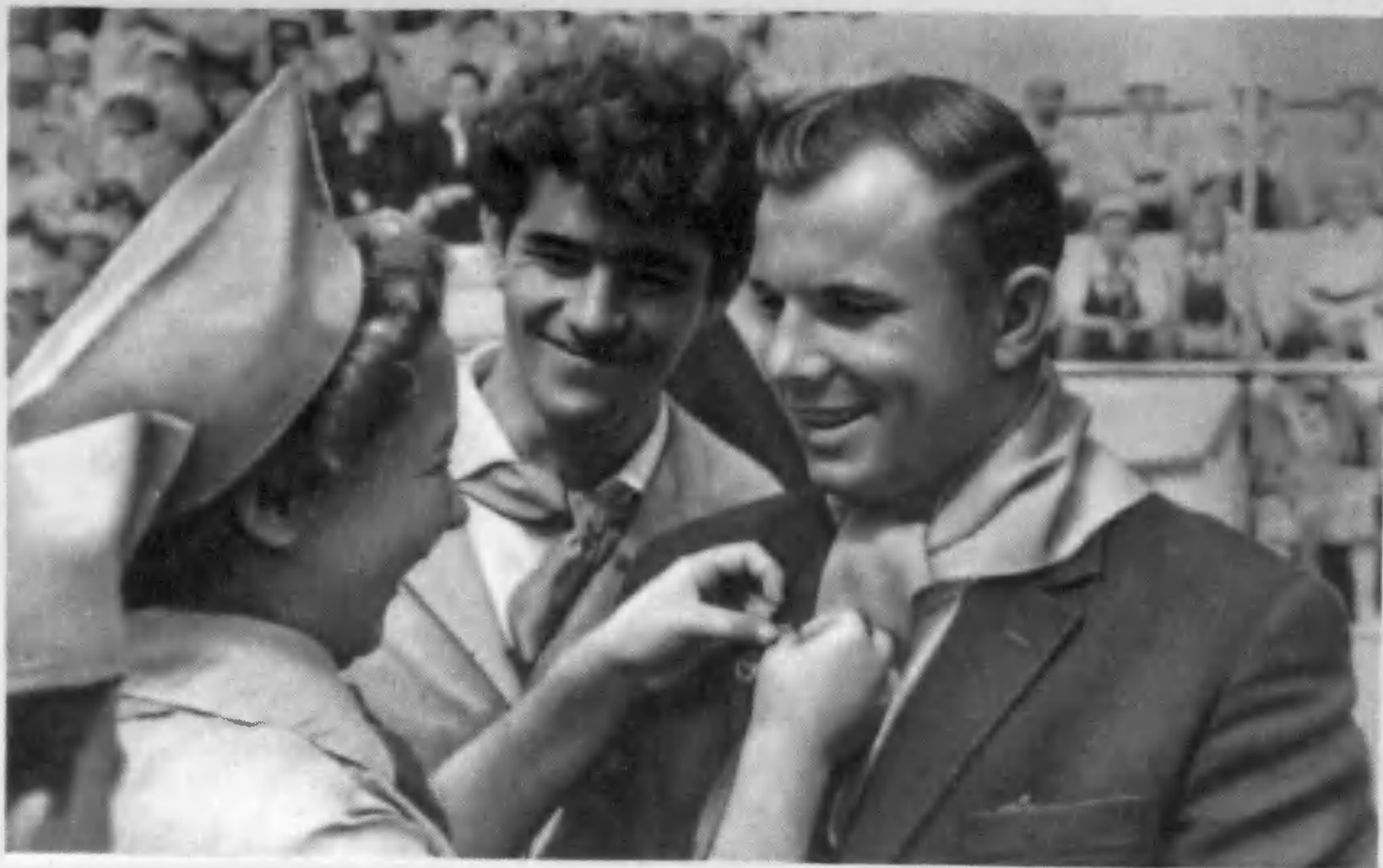
Крым. Ю. А. Гагарин — почетный пионер «Артека».