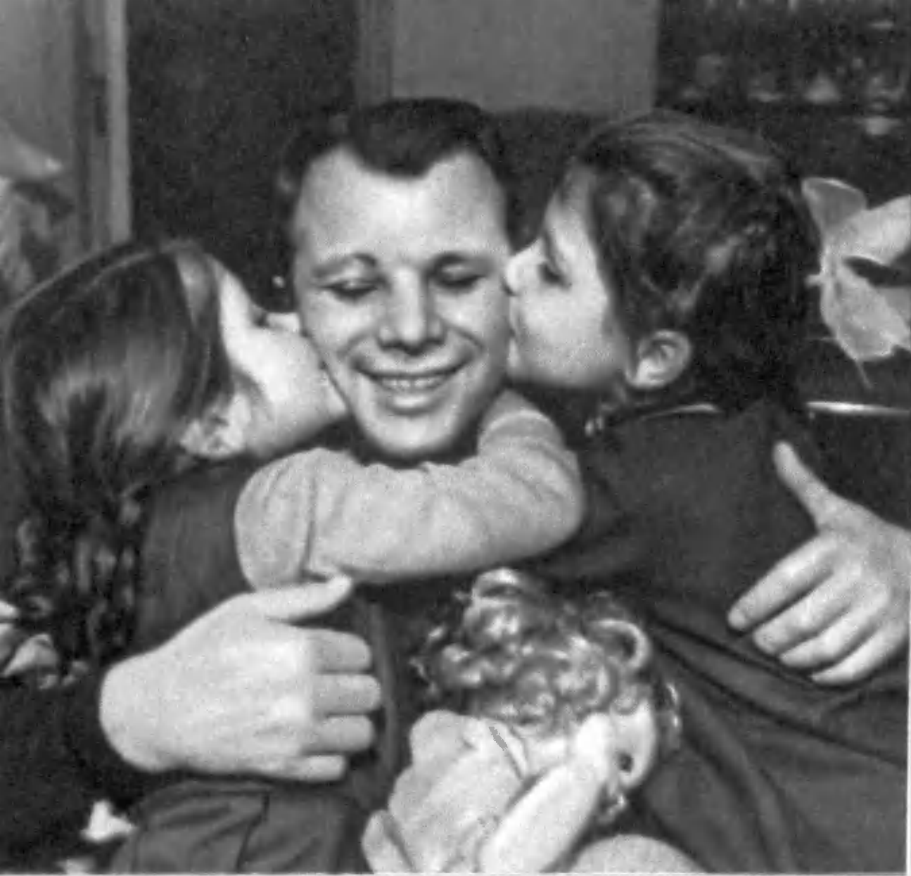
Ю. А. Гагарин и его дочери Лена и Галя.

Ленинград. 25 августа 1962 года. Ю. А. Гагарин выступает на VII Всемирном конгрессе Международного союза сту- дентов.