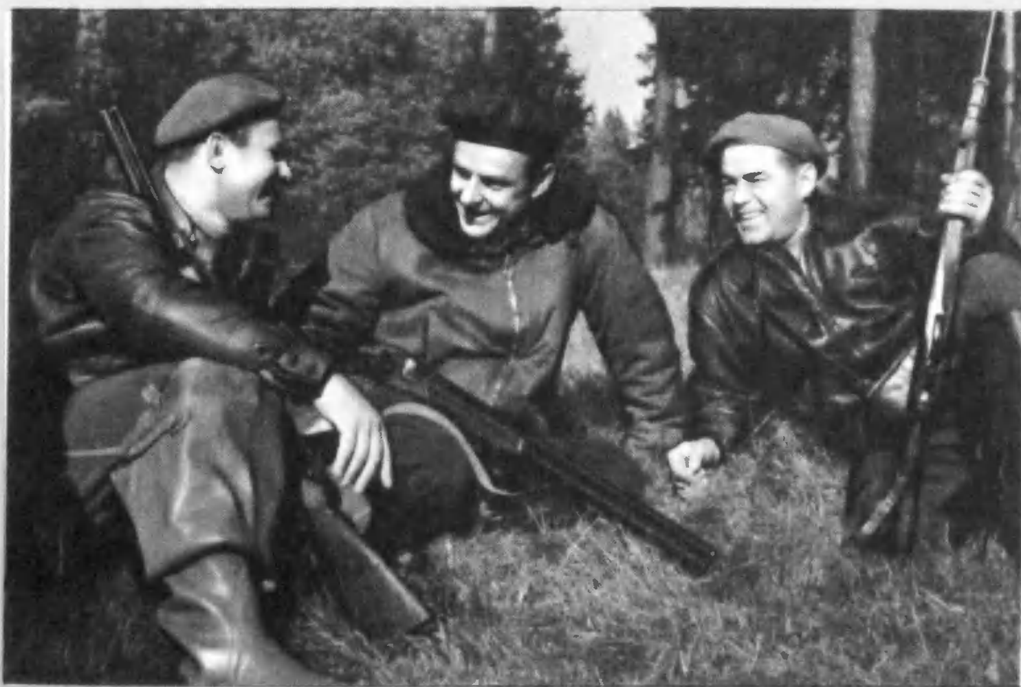
Ю. А. Гагарин, В. М. Комаров и А. Г. Николаев на охоте.