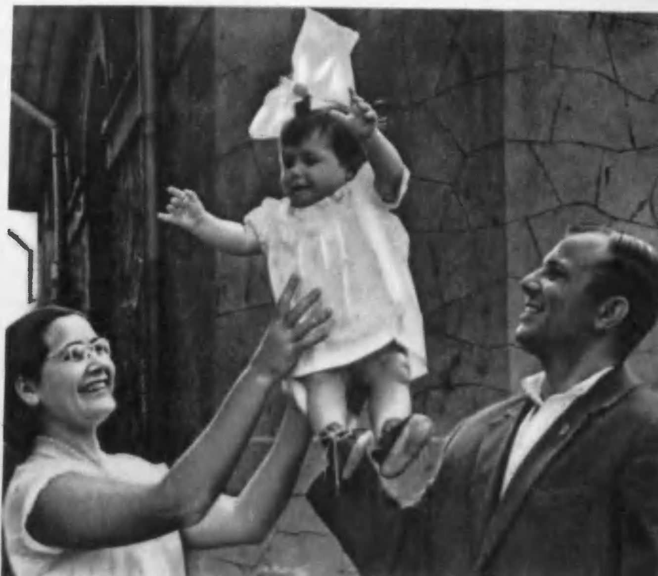
Юрий и Валентина Гагарины с дочкой Галочкой на отдыхе.