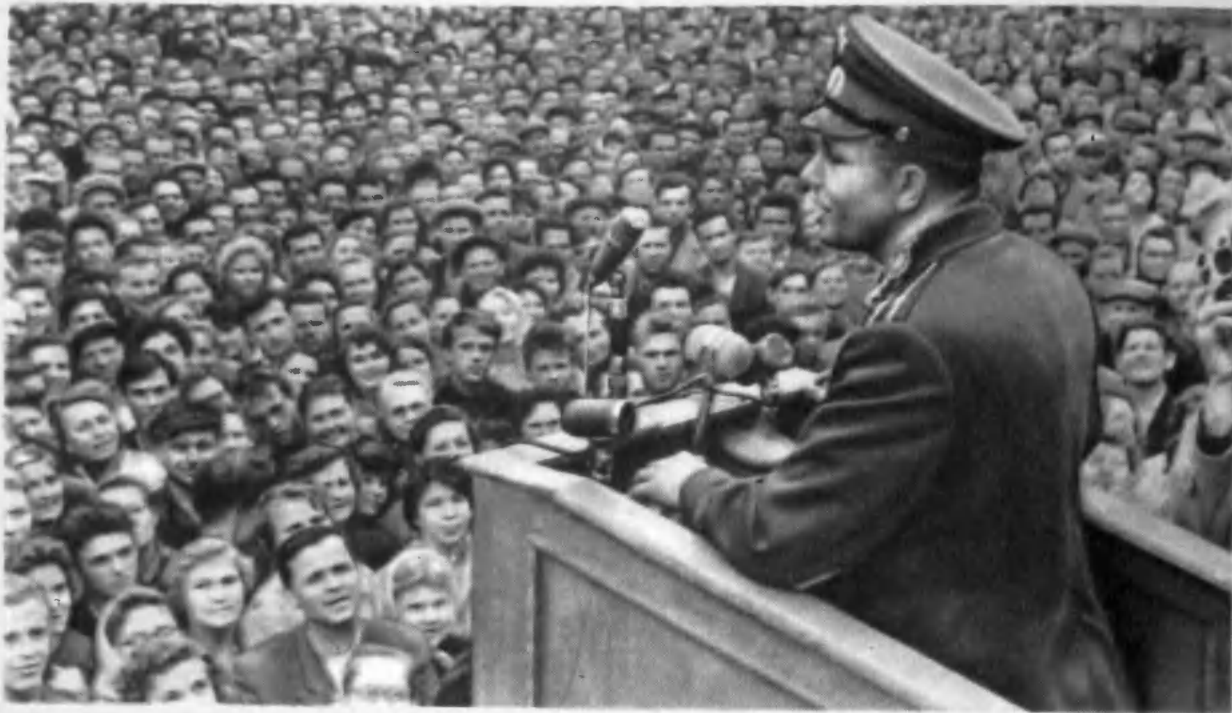
Ленинград. Металлический завод. Ю. А. Гагарин выступает перед трудящимися.