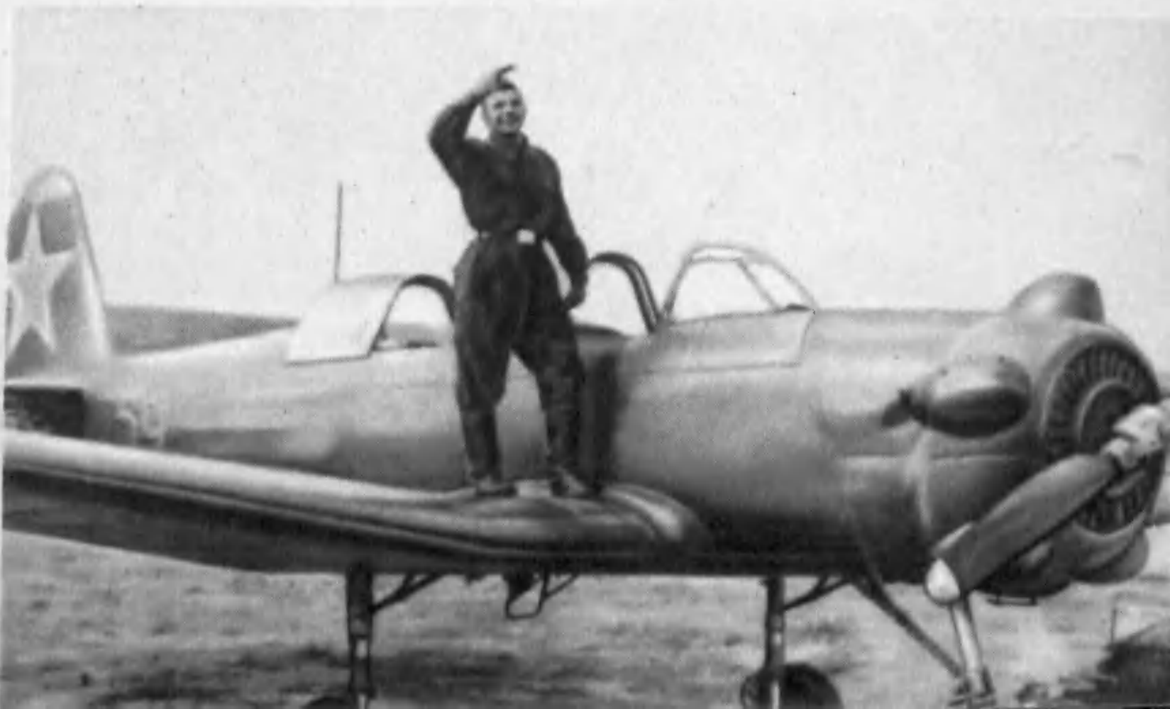
В годы учебы в Саратовском аэроклубе.